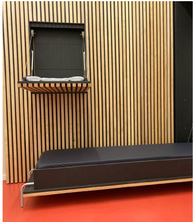
Ruheraum in der Herrenhäuser Straße

unterstützen diese Arbeit. Angestoßen von der aktuellen politischen Lage und verstärkten antidemokratischen Bestrebungen nutzen das Institut für Landschaftsarchitektur und das Institut für Freiraumentwicklung die Fensterfronten der Herrenhäuser Straße 2A, um den Werten ihrer Lehre und Forschung eine größere Außenwirkung zu geben. Auf Grundlage des Statements des Präsidenten, der Stellungnahme der LandesHochschulKonferenz Niedersachsen und der Hochschulrektorenkonferenz wurden unterschiedliche Ideen für die Fassade entwickelt. Angesichts des aktuellen Diskurses, ist es für uns nicht nur wichtig für die demokratischen Werte einzustehen, sondern sich auch der Rolle in der Lehre bewusst zu werden. Wir vertreten und lehren die Werte der Universität und verpflichten uns für diese einzustehen. Insbesondere gilt es die Forschungsfreiheit zu bewahren und zu schützen. Mit dem Statement: „Wir leben: Vielfalt Eigenart Schönheit Toleranz Offenheit Demokratie Respekt.“ positionieren wir uns klar für eine demokratische, offene, diverse und kreati-